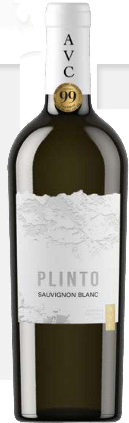
PLINTO IGP SAUVIGNON BLANC