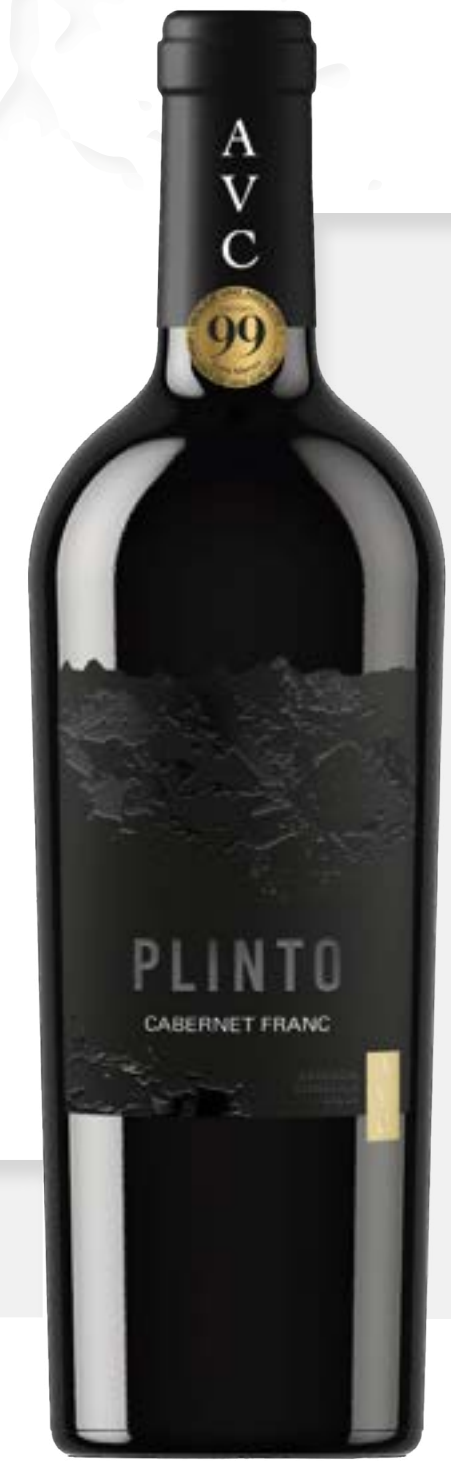
PLINTO IGP CABERNET FRANC